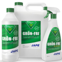
Volym: 1 liter 5 liter 0,5 liter Art.nr. 13012 13024 13011

En serie effektiva desinfektions- och rengöringsmedel från Jape. Väljer du dessa produkter får du ett heltäckande system för underhåll av fasader och andra ytor. Samtliga produkter är biologiskt nedbrytbara.