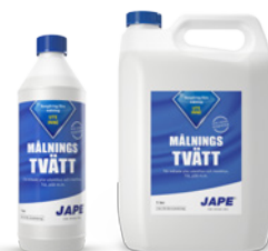
Volym: 1 liter 5 liter Art.nr. 13912 13924

1 del Underhållstvätt spädes med 20 delar vatten. 1 liter brukslösning räcker upp till 15 m 2 .