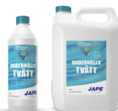
Volym: 1 liter 5 liter Art.nr. 13812 13824

1 liter Mögel-Fri brukslösning (spädes ej) räcker till ca 5 m 2 .