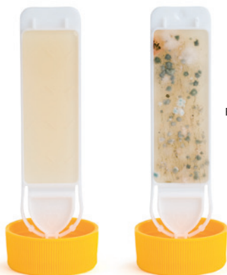
Resultat 3 dagar efter provtagning mot yta med mögelpåväxt.