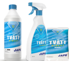
Volym: 1 liter 5 liter Tvättduk Art.nr. 14212 14211 14200

1 del Målningstvätt spädes med 20 delar vatten. 1 liter brukslösning räcker upp till 15 m 2 .