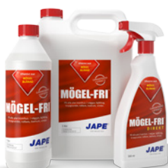
Volym: 1 liter 5 liter 0,5 liter Art.nr. 11812 11824 11811

1 flaska Grön-Fri Direkt räcker till ca 2,5 m 2 (spädes ej)