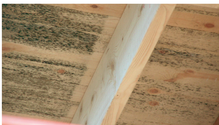
Omålat takutsprång med svarta prickar av mögel.