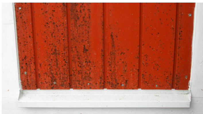
Fasad målad med Falu rödfärg. Missfärgad av mögel.