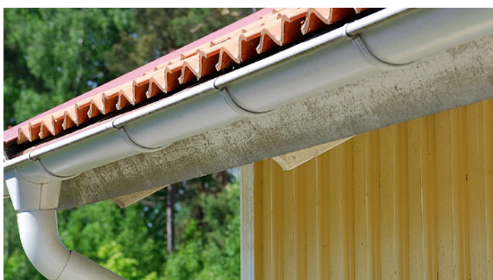
Takfotsbräda med angrepp av svarta prickar av mögel.