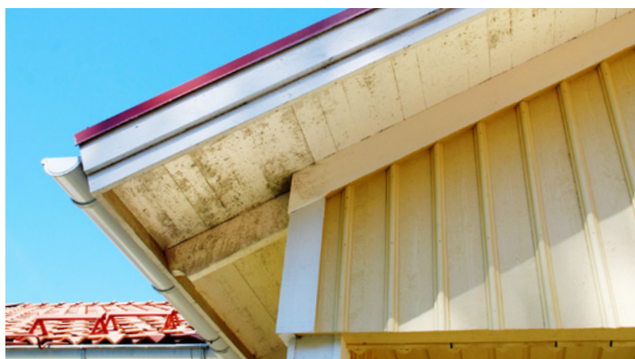
Underslag med angrepp av mögel. Täckmålat trä.